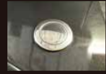
ポップアップ水栓