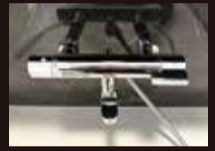
壁付シャワー水栓 (サーモスタット)