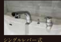
シングルレバー式 シャワー水栓