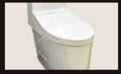
節水型トイレ ピュアレストEX