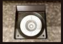
お掃除ラクラク排水口