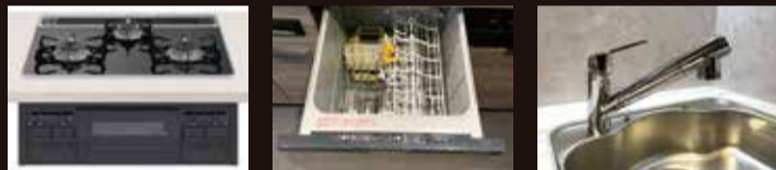
ハイパーガラスコートトップ 3口コンロ